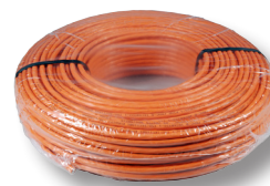
100 m Ring