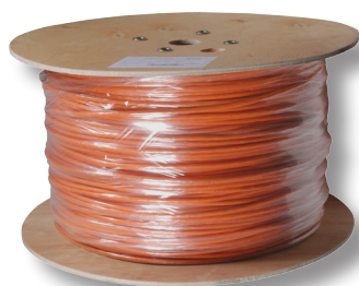
500/1000 m Trommel